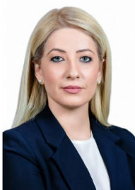
Ms Annita DEMETRIOU President

Βουλή των Αντιπροσώπων / House of Representatives