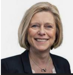
Ms Eliane TILLIEUX Speaker

Chambre des représentants / Kamer van volksvertegenwoordigers / House of Representatives