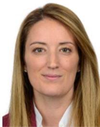
Ms Roberta METSOLA President