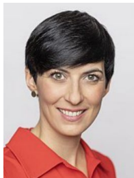
Ms Markéta PEKAROVÁ ADAMOVÁ Speaker

Poslanecká sněmovna / Chamber of Deputies