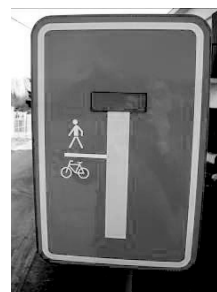
“F45b: aangepast aan situatie”

Het staat de wegbeheerder vrij om de verkeersborden F45b en F45c aan te passen aan de lokale situatie wanneer dit een significante bijdrage levert aan de leesbaarheid van de verkeerssituatie. Uiteraard geschiedt dit in overeenstemming met het verdrag van Wenen van 8 november 1968 inzake het wegverkeer. Hierbij dienen wel als basis het F45 bord gebruikt te worden, alsook de drie bijkomende iconen van bord F45b: het lijntje, de voetganger en/of de fietser. Een voorbeeld is hieronder aangegeven.