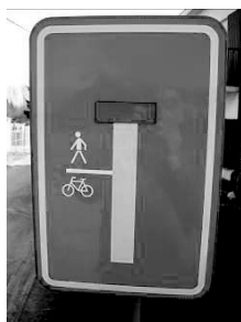
“F45b: adapté à la situation”

Le gestionnaire de la voirie est libre d’adapter les signaux F45b et F45c à la situation de circulation locale, si cette adaptation apporte une contribution significative à la lisibilité de ladite situation. Cela se fait naturellement conformément à la Convention de Vienne du 8 novembre 1968 sur la signalisation. À cet égard, il convient cependant d’utiliser le signal F45 comme base, ainsi que les trois icônes supplémentaires du signal F45b: le trait, le piéton et/ou le cycliste. Un exemple est donné ci-dessous.